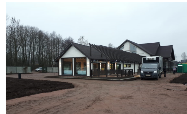
Здание конного клуба