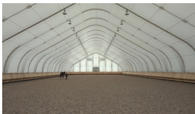
Каркасно-тентовый манеж с индивидуальным бортом