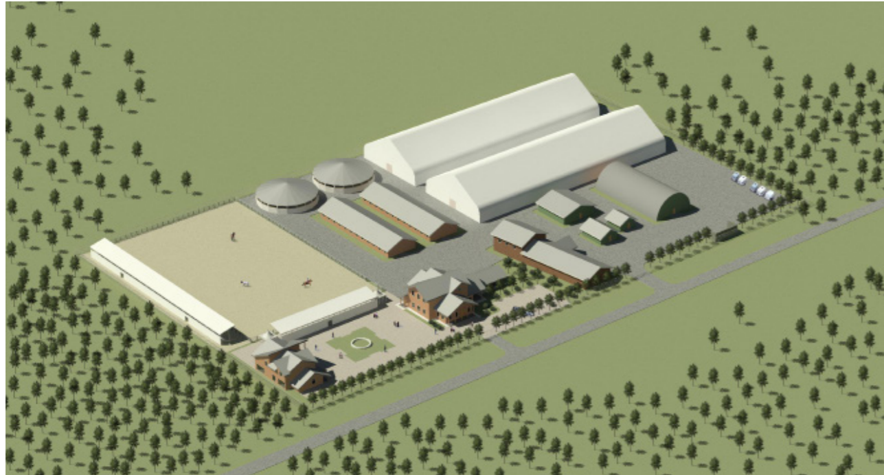
Вид всего комплекса