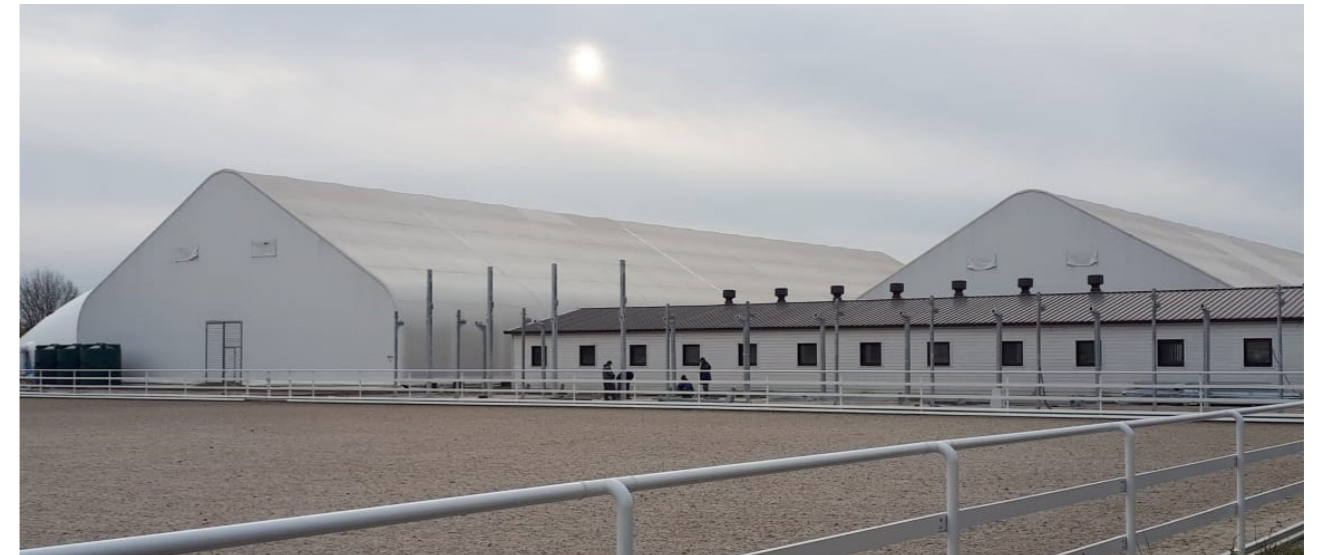
Поле, конюшни и манежи

Проект расширения конноспортивного клуба на берегу Невского залива предполагал значительную модернизацию всей территории. К существующей конюшне на 20 голов, небольшим хозяйственным постройкам и маленькому манежу были добавлены 2 манежа 28x80м, две конюшни на 20 голов каждая, водилка, большое открытое поле, а также новое административное здание с кафе. Нашей мастерской была разработана концепция всей территории, план развития территории и благоустройства, а также вся рабочая документация для первой очереди строительства. В проекте основным материалом выступает дерево, как экологичный и безопасный материал для людей и животных (вся отделка конюшни выполнена из лиственницы). Белый цвет придает комплексу благородство и некоторую торжественность.