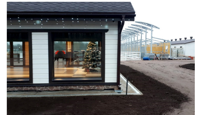
Здание конного клуба