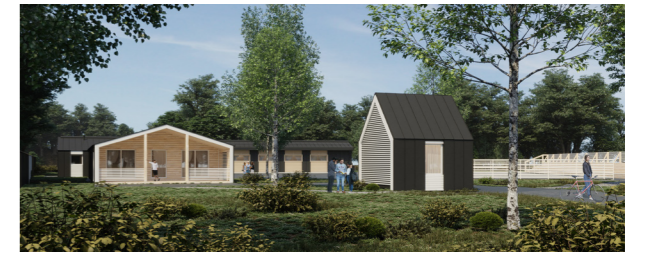
Концепция и проект