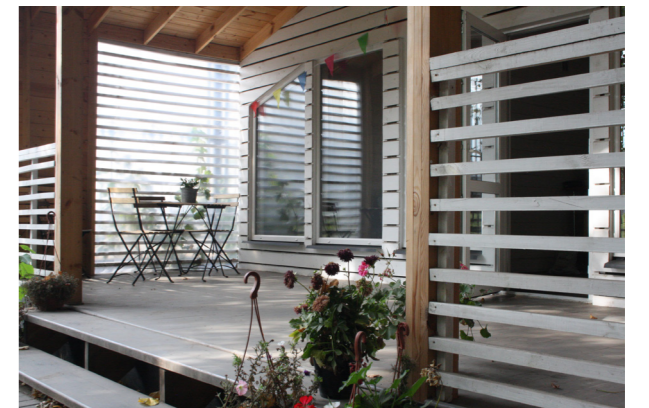
Согласования и надзор за строительством