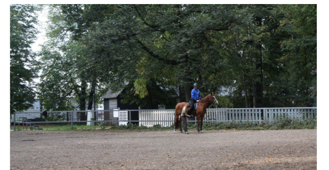
Наблюдение за реализацией